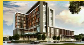
Pelan Bangunan Building Plan (BP)