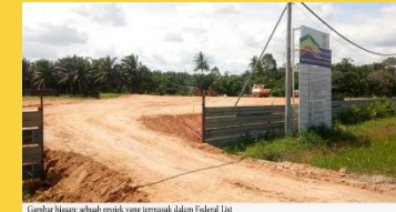
Pelan Pembangunan Development Plan (DP)