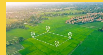
Pelan Pecah Bahagi Tanah Subdivision Plan