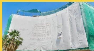
Pelan Pengubahsuaian Renovation Plan (RP)